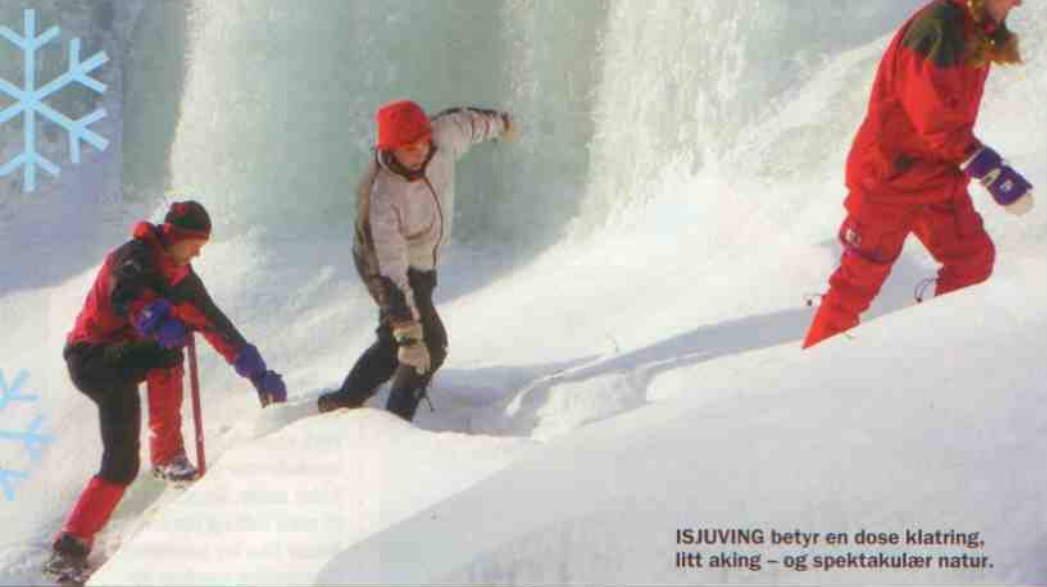
ISJUING betyr en dose klatring, litt aking – og spektakulær natur.