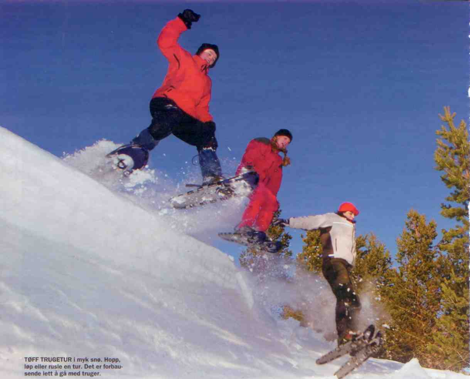
TØFF TRUGETUR i myk snø. Hopp, løp eller rusle en tur. Det er forbau-sende lett å gå med truger.