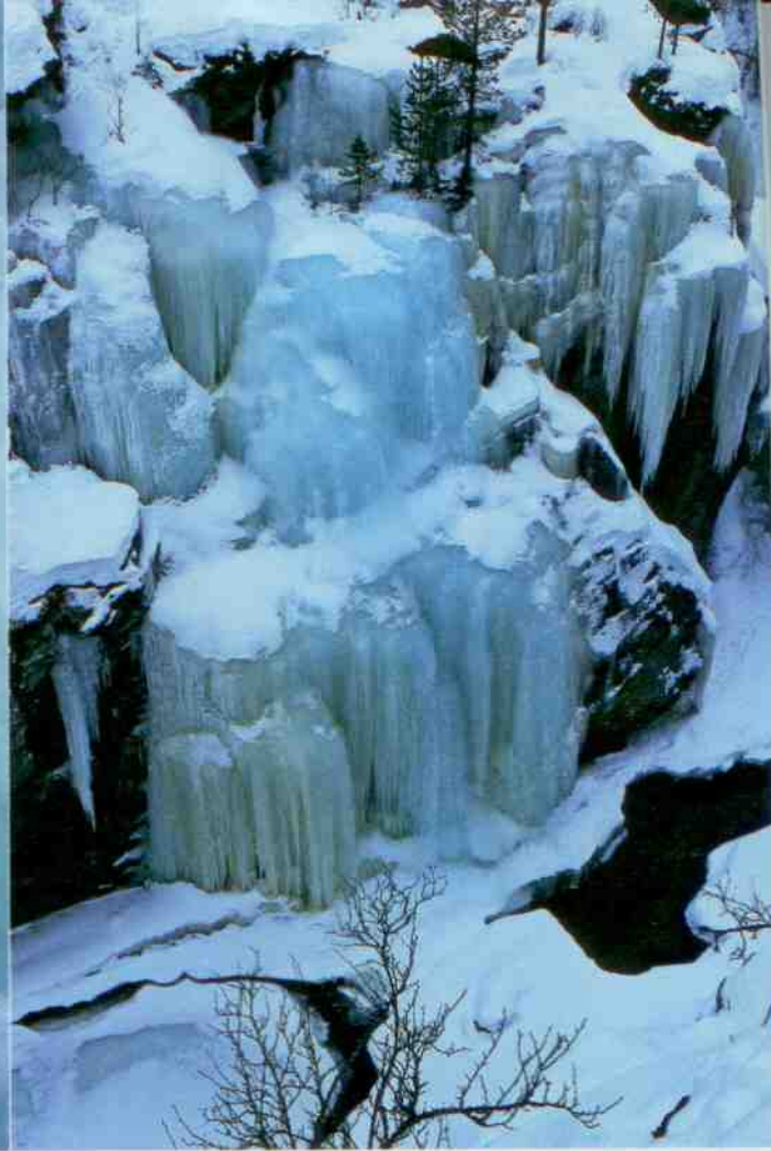
Kristalline Kunst: Ein Wasserfall erstarrt zur Gletscherskulptur.